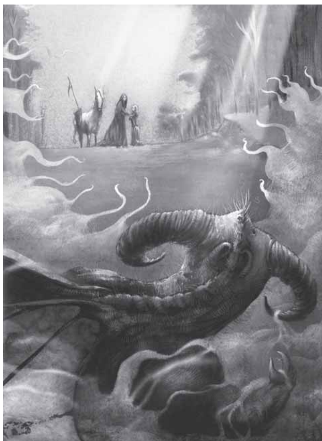
Roger Olmos ha il·lustrat amb unes magnífiques i tètriques làmines la llegenda de sant Jordi.

El mercat del llibre infantil en català és un mercat en expansió. Tal com es pot veure a les dades de 2007 que publica l'Institut Nacional de Estadística, els llibres per a infants i joves en català ocupen gairebé el catorze per cent de la producció editorial en aquesta llengua i són, per a més d'una editorial, el coixí econòmic. En relació amb la producció a l'Estat, les dades també són